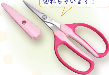
クラフトチョキ 商品コード 99-00390 1,980円(税込)