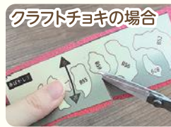
クラフトチョキの場合

一般的なはさみは根本部分でしか切れ ないため、細かく動かすことができず、 線通りに切ることが難しいです。 それに対しクラフトチョキは先端部分で 切れるので、細かく動かすことができ、 線通りにきれいに切ることができます!