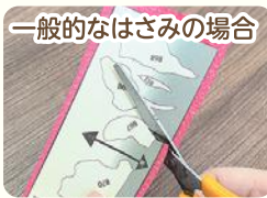
一般的なはさみの場合