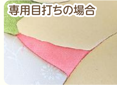
専用目打ちの場合

針が太い目打ちで作ると、ミゾが 太くなり、布が綺麗に入らず布端が 見えますが、専用目打ちで作ると、 布端を綺麗にミゾの中にきめこめます!