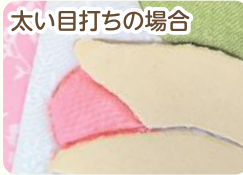
太い目打ちの場合