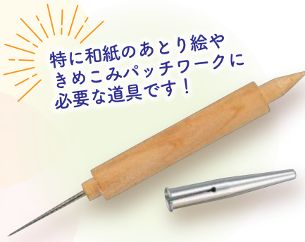
専用目打ち 商品コード 99-00648 385円(税込)

使いやすさはそのままに 仕様が変わりました! さくらほりきりの作品を作る方に絶対に欠かせない道具!