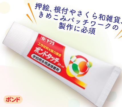
ボンド ボンドタッチ 商品コード 99-00549 187円(税込) 内容量/24ml