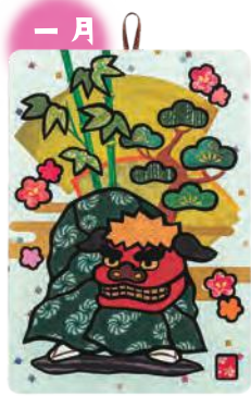
季節のシールはり絵・ 新春獅子舞 (一月)