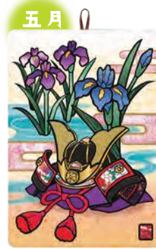
季節のシールはり絵・ 節句兜 (五月)