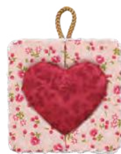
①きめこみパッチワーク

いろいろな作り方をお試しください。6種類を まとめてお求めやすい価格にしています。そのため 各種類を別々にご注文いただくことはできません ので、ご了承ください。