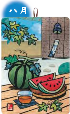
季節のシールはり絵・ 夏の縁側 (八月)