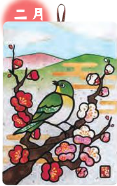
季節のシールはり絵・ メジロと紅白梅 (二月)