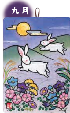
季節のシールはり絵・ 十五夜跳ねうさぎ (九月)