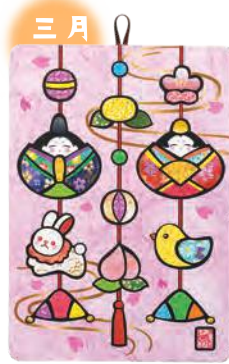
季節のシールはり絵・ つるし雛 (三月)