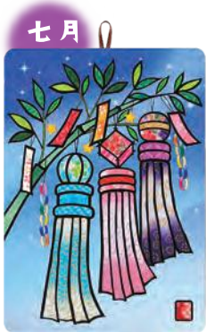
季節のシールはり絵・ 七夕まつり (七月)