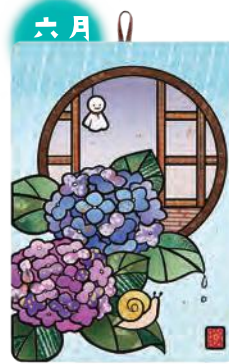
季節のシールはり絵・ 紫陽花 (六月)