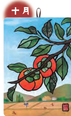
季節のシールはり絵・ 柿と田んぼ (十月)