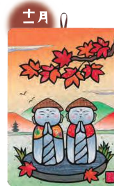
季節のシールはり絵・ お地蔵さん (十一月)