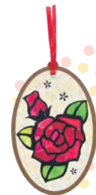
⑤シール ちぎりあーと