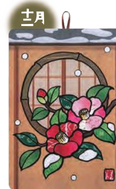
季節のシールはり絵・ 雪と寒椿 (十二月)