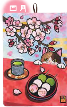
季節のシールはり絵・ お花見団子 (四月)