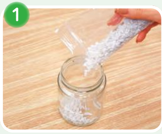
1 ビンの中に砂利を入れます。