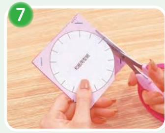
7 和紙と型紙を合わせてホチキスで固定し、黒線をはさみで切ります。