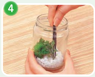
4 造花にボンドタッチをつけ砂利に埋め込むようにして付けます。