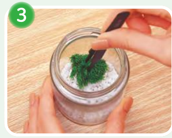
3 砂利に苔を貼り付けます。