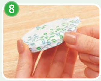
8 和紙にボンドタッチをつけてフタに貼ります。