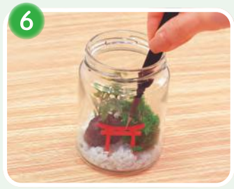
6 鳥居を砂利に挿します。