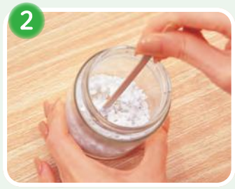
2 ボンドタッチを入れて付属の棒で砂利と混ぜ合わせます。